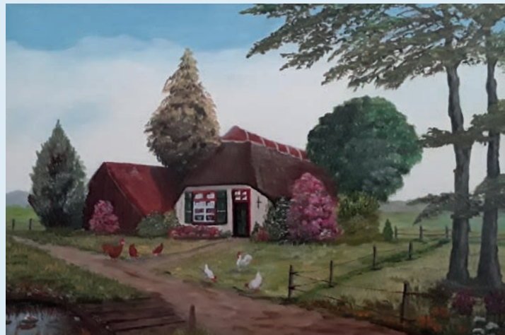
Schilderij van Schilderclub de Regenboog uit Wapenveld

Schilderclub De Regenboog uit Wapenveld exposeert haar schilderijen met het thema "Onze mooie Veluwe" van 23 augustus t/m 8 oktober 2019 in de foyer van het gemeentehuis.